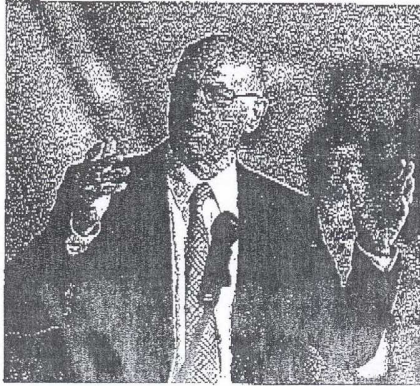
رئيس البروندستاغ الألماني توربيرت لاميرت، راعي برنامج المنح البرلمانية الدولية